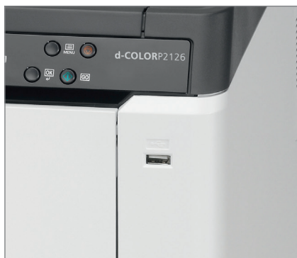
Porta USB per stampa diretta da chiavetta