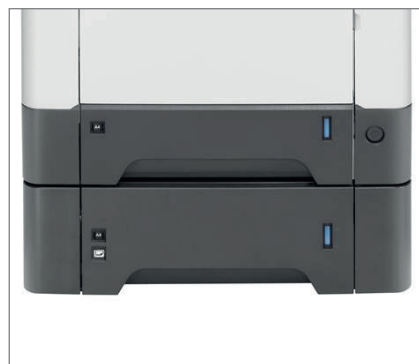
Gestione carta flessibile