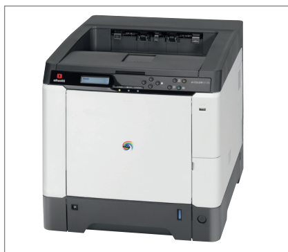
Compatte e maneggevoli