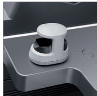
Opzioni di sicurezza evolute, molteplici sistemi di autenticazione