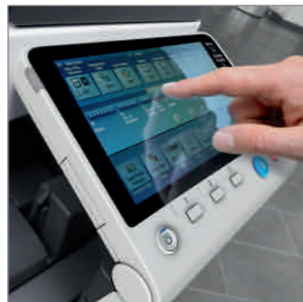
Pannello di controllo multi-touch 9,0" con tastierino 10 tasti (opzionale)

Le nuove Olivetti d-Color MF652plus e d-Color MF752plus, grazie alla loro velocità fino a 75 pagine al minuto, ed alla loro alta risoluzione in stampa di 1200 x 1200 dpi, possono affrontare senza problemi i carichi di lavoro più pesanti degli uffici. La gamma di impiego oggi si allarga anche ai centri di produzione di stampa, oppure agli operatori di arti grafiche, grazie all'opzione Fiery in grado di gestire al meglio i profili colore. Tutto questo nel pieno rispetto del nuovo standard Energy Star 2.0